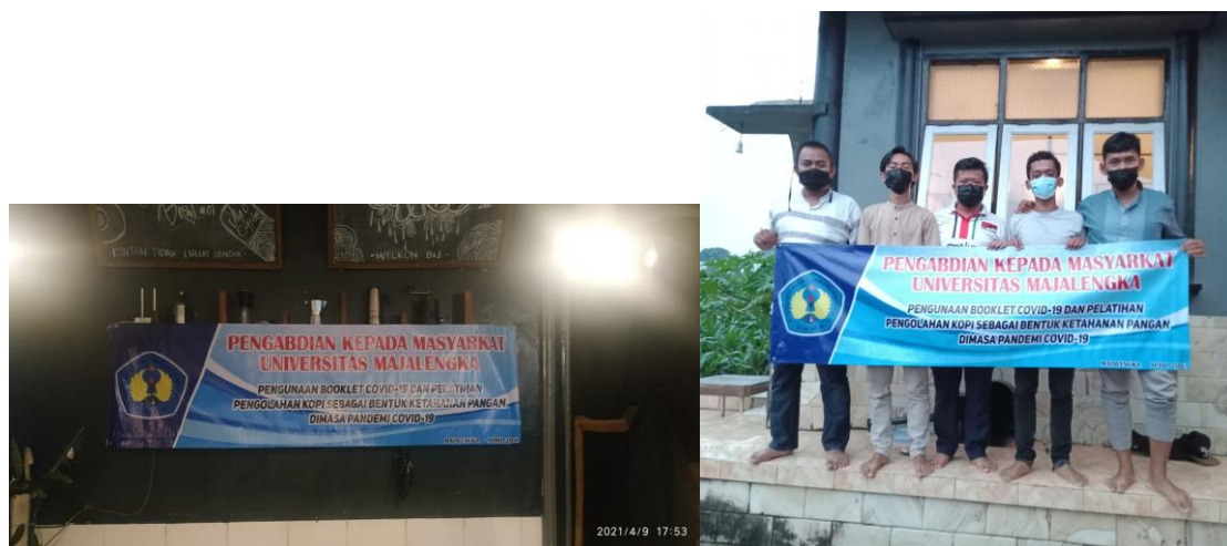
Gambar 3 Pelaksanaan Pelatihan pengolahan Kopi

Selain memberikan booklet tim pengabdian juga melaksanakan pelatihan kopi sebagai bentuk ketahanan pangan pada masa pandemic Covid-19. Berikut gambaran kegiatan yang dilaksanakan di Villa O'Coffe di Kabupaten Majalengka.