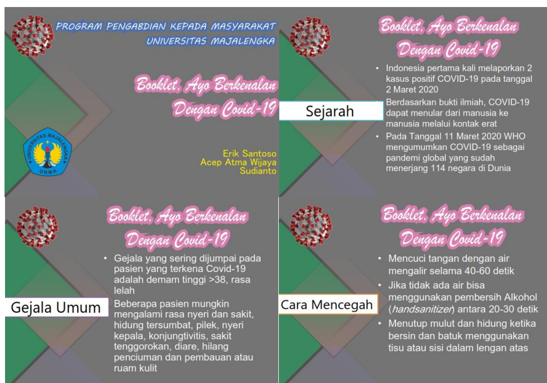
Gambar 1 Beberapa Tampilan Booklet

Kegiatan perencanaan dilaksanakan dengan melibatkan tim pengabdian yang terdiri dari ketua dan dua anggota. Pembuatan booklet disesuaikan dengan karakter masyarakat di Desa Kulur Majalengka, pembuatan booklet dibuat sederhana agar mudah dipahami oleh masyarakat. Gambaran Booklet yang disusun adalah sebagai berikut: