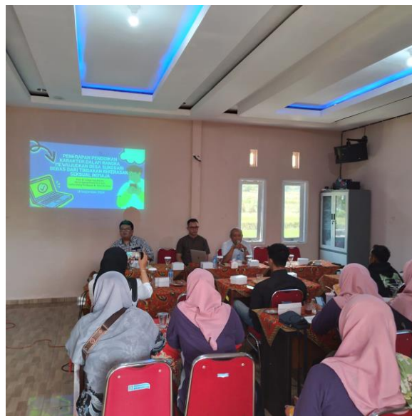
Gambar 2 Pelaksanaan Kegiatan Pengabdian

"Dalam rangka mewujudkan Desa Sukosari yang bebas dari tindakan kekerasan seksual remaja, kegiatan pengabdian masyarakat ini bertujuan menerapkan pendidikan karakter secara intensif kepada generasi muda. Pembicara menjelaskan pentingnya membangun nilai-nilai moral dan etika di kalangan remaja sebagai langkah pencegahan terhadap tindakan kekerasan seksual. Dengan pendekatan edukasi yang holistik, diharapkan para peserta memahami peran mereka dalam menciptakan lingkungan yang aman dan mendukung bagi tumbuh kembang remaja. Acara ini juga menjadi forum diskusi antara para narasumber dan masyarakat, untuk bersama-sama mencari solusi atas isu kekerasan seksual di desa tersebut."