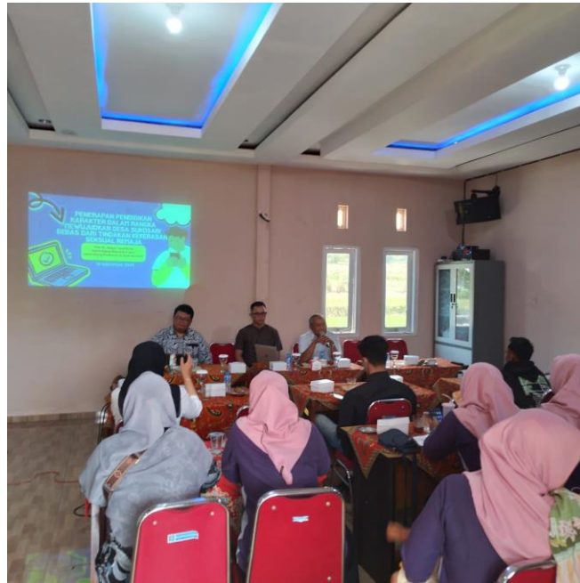
Gambar 1 Kegiatan Pengabdian

"Dalam rangka mewujudkan Desa Sukosari yang bebas dari tindakan kekerasan seksual remaja, kegiatan pengabdian masyarakat ini bertujuan menerapkan pendidikan karakter secara intensif kepada generasi muda. Pembicara menjelaskan pentingnya membangun nilai-nilai moral dan etika di kalangan remaja sebagai langkah pencegahan terhadap tindakan kekerasan seksual. Dengan pendekatan edukasi yang holistik, diharapkan para peserta memahami peran mereka dalam menciptakan lingkungan yang aman dan mendukung bagi tumbuh kembang remaja. Acara ini juga menjadi forum diskusi antara para narasumber dan masyarakat, untuk bersama-sama mencari solusi atas isu kekerasan seksual di desa tersebut."